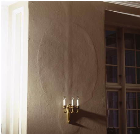
Fig.1 Detalje fra Marmorsalen (rum 19) på Hindsgavl hovedbygning. Væggene bærer endnu spor af de oprindelige, pudsede fyldingsfelter fra 1786.

I 2003 blev restaureringen af fortidsminder fra oldtiden og historisk tid overflyttet til Nationalmuseet fra Kulturarvsstyrelsen. Der fulgte tre medarbejdere samt et driftsbudget med.